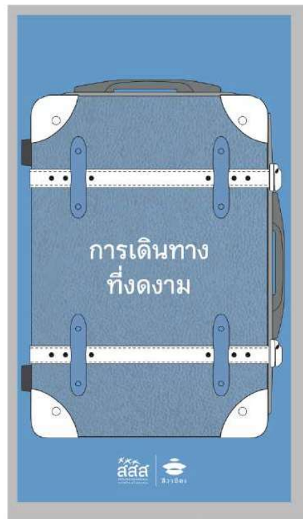
5. การเดินทางที่งดงาม