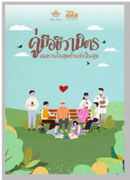
1. คู่มือซีวามิตร

บริษัท ซีวามิตร วิสาหกิจเพื่อสังคม จำกัด เป็นศูนย์รวมข้อมูลและทำกิจกรรมในการ “สนับสนุน” และ “ผลักดัน” ให้คุณภาพชีวิตระยะท้าย ด้วยเชื่อว่าทุกคนมีสิทธิ์ที่จะมีคุณภาพชีวิตระยะท้ายที่ดี และจากไปอย่างมีความสุข หนังสือแนะนำ จากซีวามิตร สามารถดาวน์โหลดได้ฟรี