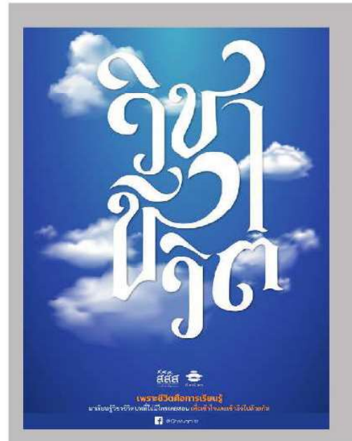
2. วิชาชีวิต