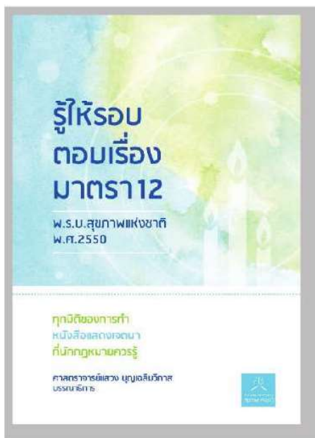
4. รู้ให้รอบตอบเรื่องมาตรา 12